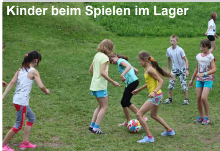
Kinder beim Spielen im Lager