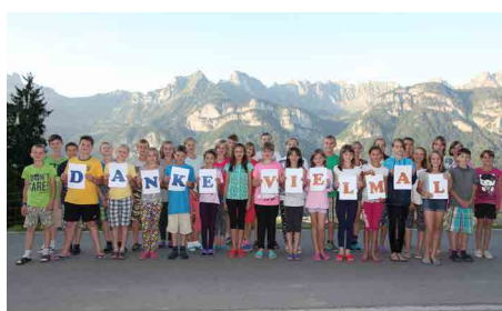
15. Kinderlager 17. Juli – 7. August 2018