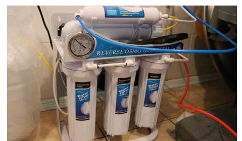
Sauberes Wasser für Luginis Schulen