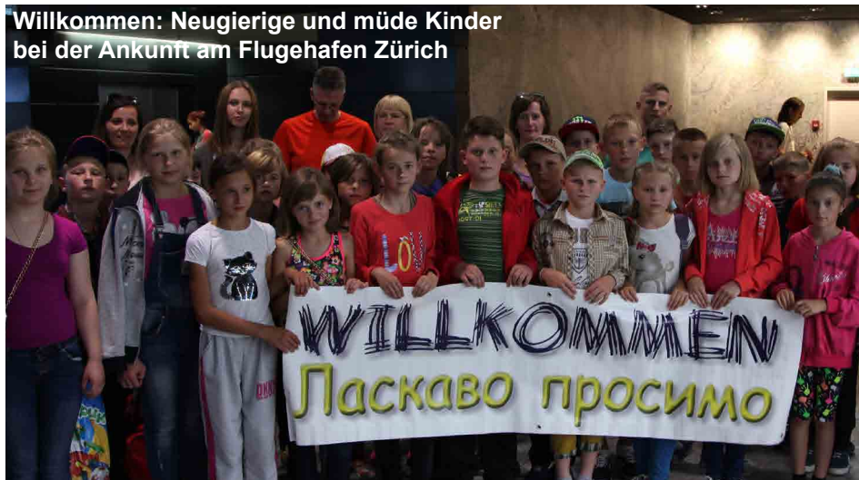
Willkommen: Neugierige und müde Kinder bei der Ankunft am Flughafen Zürich